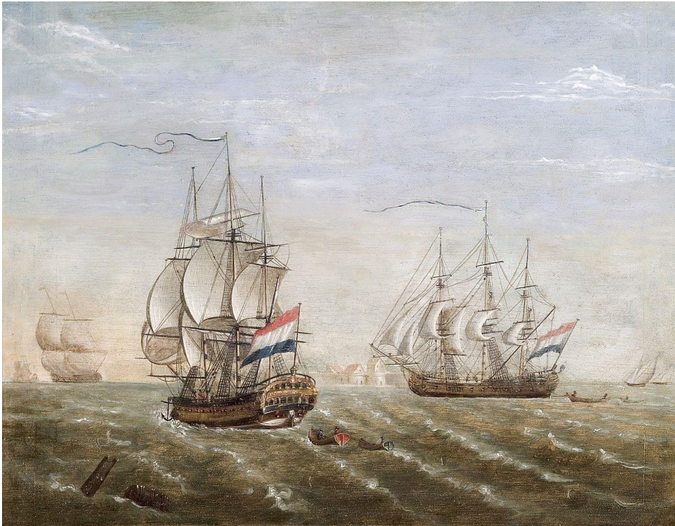
VOC-schip 'Slot Ter Hooge' op de rede van Rammekens