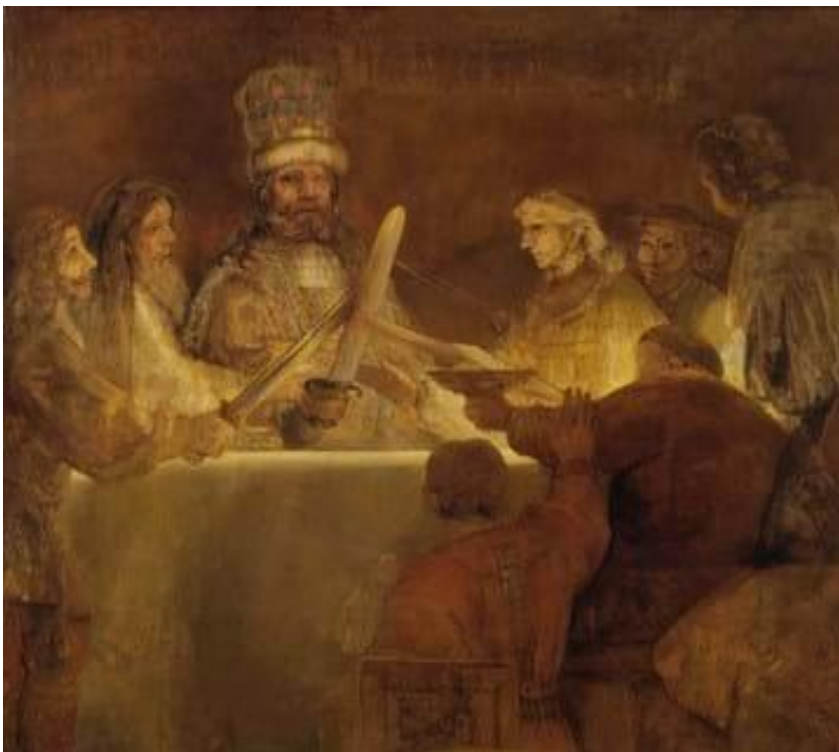
9. Rembrandt van Rijn: De samenzwering van de batavieren onder Claudius Civilis (1661-1662)