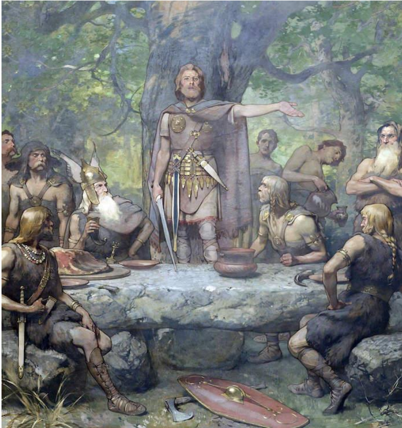
8. De oproep van Claudius Civilis – moderne afbeelding.