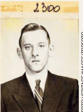
Agent die de inval leidde.