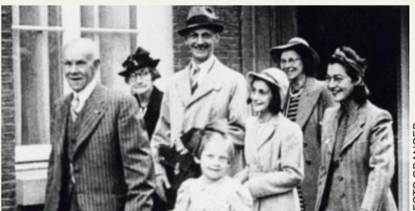
Anne Frank en haar vader Otto (midden) op weg naar de bruiloft van vrienden Miep en Jan Gies, juli 1941 in Amsterdam.

Samen met zijn vrouw Edith had Otto Frank, geboren in Frankfurt, twee dochters: Anne en Margot. Nadat Hitler in 1933 in Duitsland aan de macht kwam, besloot het gezin te vluchten naar Nederland. In Amsterdam zette Frank een handel op in pectine (een geleermiddel voor jam) en specerijen. In de eerste jaren van de oorlog deed hij vergeefse pogingen met zijn gezin te emigreren naar Amerika. In de zomer van 1942, toen de situatie voor Joden steeds benauwder werd, besloot hij onder te duiken in het achterhuis van het pand aan de Prinsengracht, waar zijn bedrijf gevestigd was. De