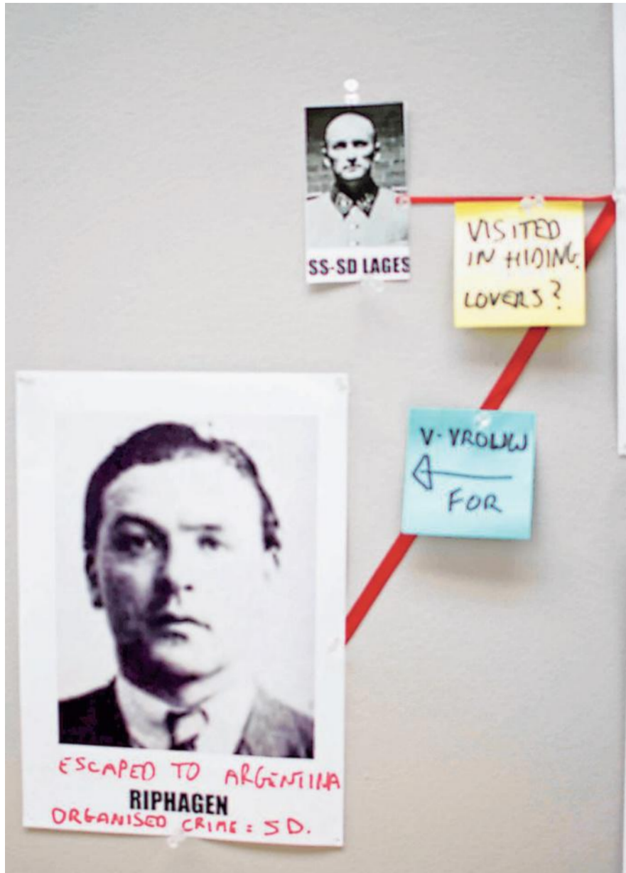
Detail van de 'wall of shame'. Een 'v-vrouw' was een informant van de Duitsers.