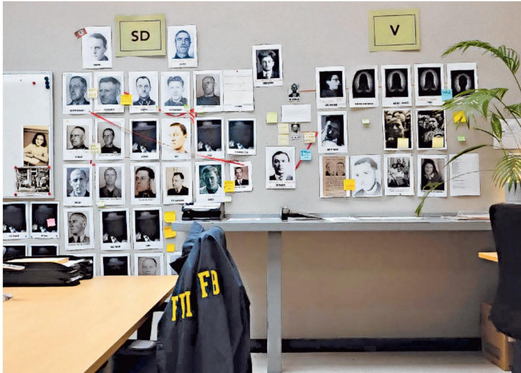
De uitvalsbasis van de onderzoekers in Amsterdam-Noord.