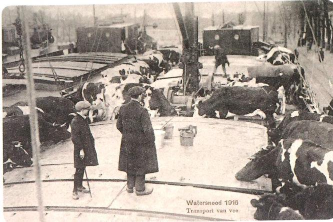
In Purmerend wordt vee per binnenvaartschip in veiligheid gebracht.